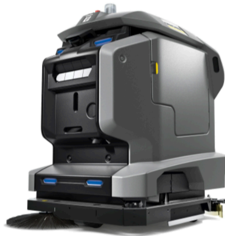
床洗浄ロボット KIRA B 50