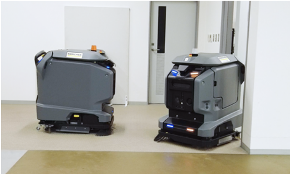
ROBO-HIによるロボットの群管理。「KIRA B 50」1機が部屋を出るまで、もう1機が待機する様子