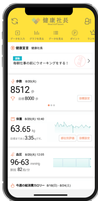
「タニタ健康プログラムwith健康社長」専用アプリトップ画面 (計測データの表示画面)