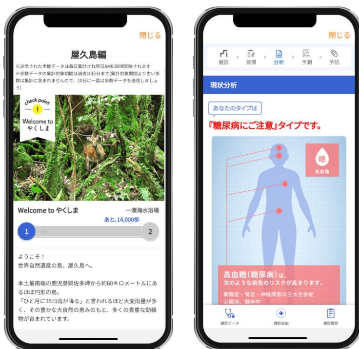
左より「ウォーキングラリー」「ミライフ」の画面

本資料に記載されている情報は発表日現在のものです。このため、時間の経過あるいは後発的なさまざまな事象によって、内容が予告なしに変更される可能性があります。あらかじめご了承ください。