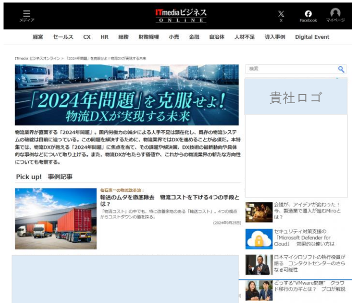
「特集」「常設コーナー」トップページ

当該特集/コーナーのトップページにタイアップ記事広告への「特設誘導枠」と「貴社ロゴ」を無償掲載します*（※）