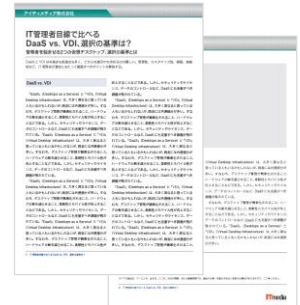
ホワイトペーパー制作イメージ （実際のデザインとは異なる場合がございます）