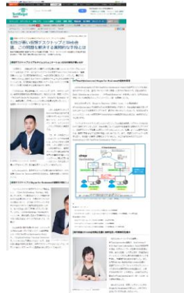
タイアップ記事制作イメージ （実際のデザインとは異なる場合がございます）