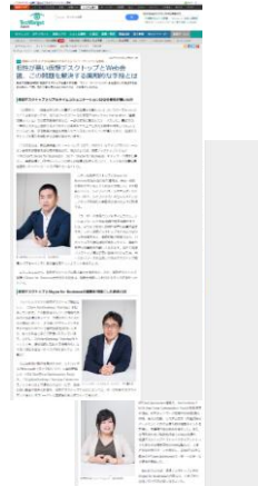
タイアップ記事制作イメージ （画像はサンプルとなります）