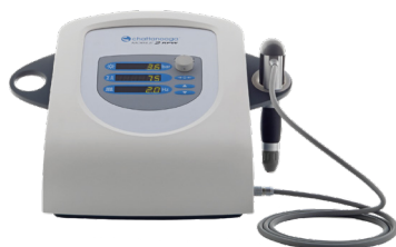
インテレクト RPW モバイル