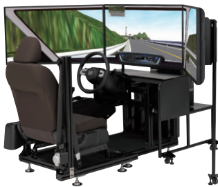
ドライビングシミュレーター