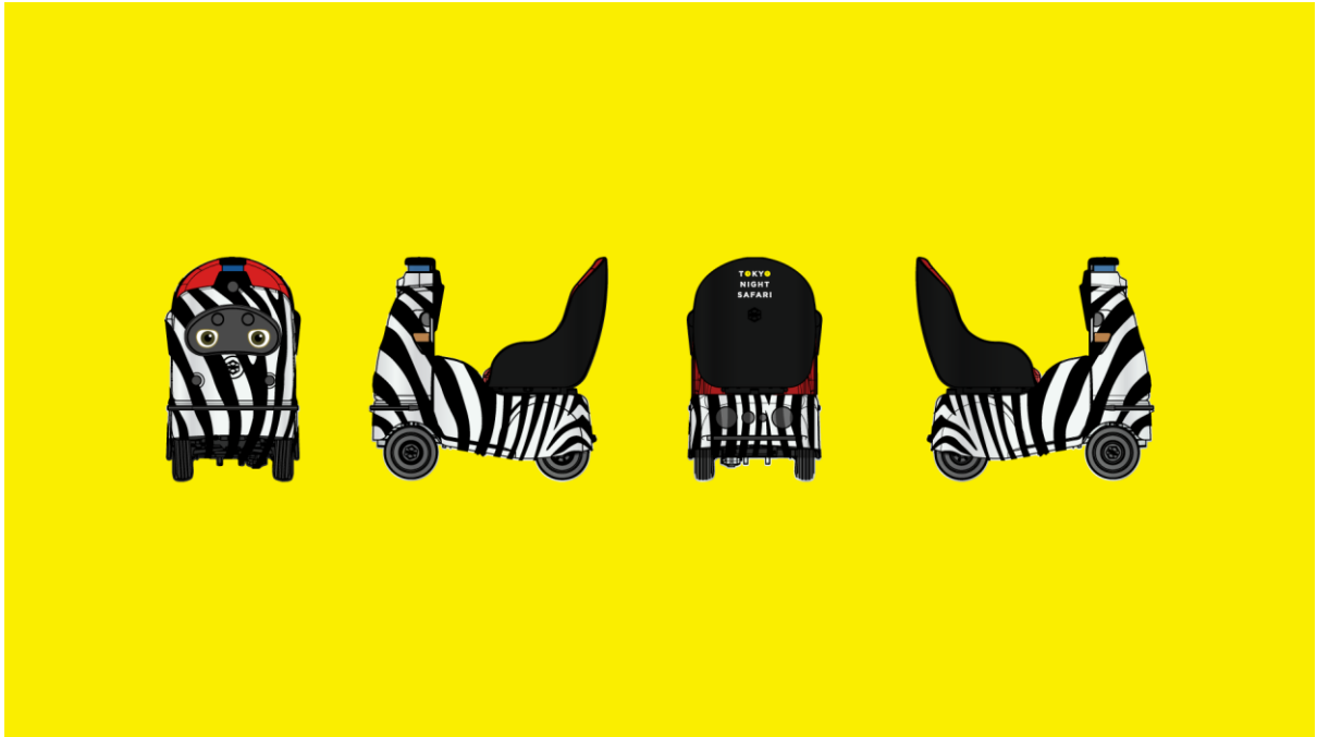
自動運転歩行速モビリティ「RakuRo®」 / 「TOKYO NIGHT SAFARI」 特別ラッピング ver