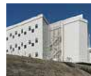
KIX13 データセンター 大阪府箕面市