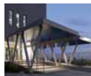
KIX12 データセンター 大阪府箕面市