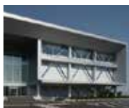
KIX10 データセンター 大阪府茨木市

平均 6kW~15kW/ ラックの電力供給が可能、ケーシング、プライベートスイート構成などお客様のニーズに合わせた幅広いサービスを提供します。