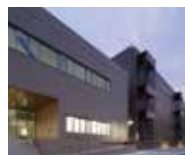
KIX11 データセンター 大阪府箕面市