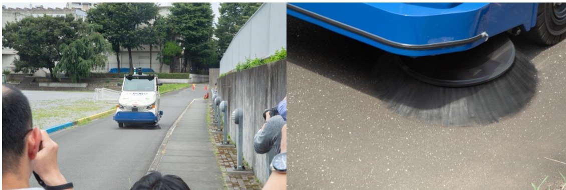
<EV ロボスーパー試作機のデモンストレーションの様子>

午後に実施された EV ロボスーパー試作機のデモンストレーションにも、多くの取材陣や見学者が訪れ、無人で動く清掃車の路上清掃にくぎづけでした。