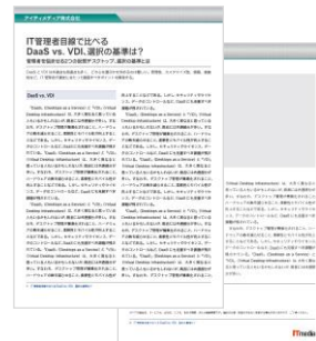
ホワイトペーパー制作イメージ (実際のデザインとは異なる場合がございます)