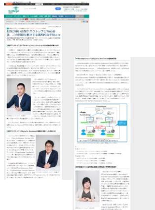
タイアップ記事制作イメージ (実際のデザインとは異なる場合がございます)