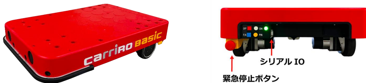
Basic 本体、オプション写真

また、CarriRo Basic を含めシリーズ製品(AD、AD+)は複雑な事前設定、工事が不要なため、最短で導入当日から利用を開始できます。