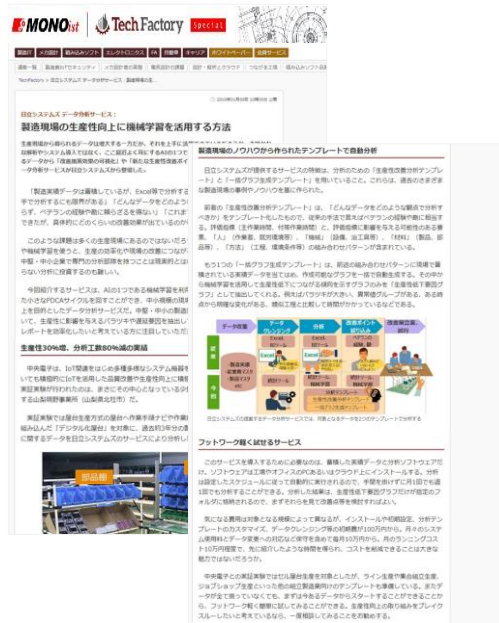
タイアップ記事制作イメージ (実際のデザインとは異なる場合がございます)