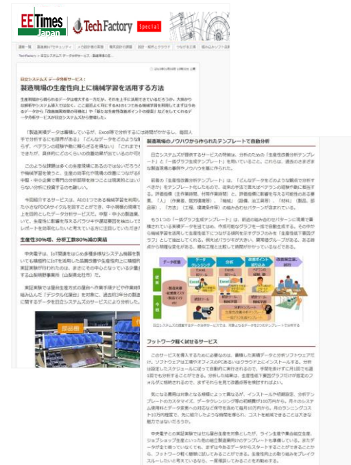
タイアップ記事制作イメージ (実際のデザインとは異なる場合がございます)