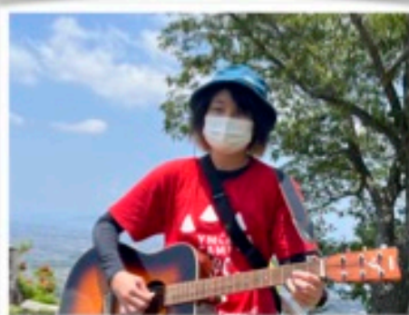
プログラムチーフ：ウルフリーダー

途中で景色の良いポイントに着き街を見下ろすと、レオマワールドが見えました。「わー！高い！レオマワールドがおもちゃみたい！」「おーい！レオマの人ー！やっほー！」と叫んだりしながら、景色を楽しむ子どもたちでした。そして、城山の頂上に到着！「やった～！やっほー！！」と大きな声で叫ぶと、喜びで疲れも吹き飛びます。そして、まだ頑張っている他のグループに向けて、「あとちょっとだよー！」「がんばれー！！」と励ましてくれる子どもたちでした。 幼児や学年の小さいグループの子どもたちも、自分たちの行けるところまで頑張って登りました。頂上まではいけませんでしたが、景色のいいポイントに立ち、「やっほー！」と叫びそれぞれのペースで山登りを楽しむことができました。お弁当を食べ、グループごとに下山していきます。行きとは違うルートで帰り、途中で沢を見つけて手や足をつけて山水の冷たさを感じ、クールダウンした子どもたち。きれいな水を頭からかける子どもも続出！「気持ちいい～！最高！」と、何度も顔を洗ったりしていました。 どの学年も、自分たちのできるのところまで登りきり、山を存分に堪能した一日となりました。 【担当ディレクターより】 今回の山登りでは、リーダーたちは子どもたちの頑張る姿や励まし合う姿にパワーをもらった1日となったように思います。一人では頑張りがきれなかったことも、グループの友だちやリーダーがいるから 頑張りができた。頂上に登ったときの喜びは、友だちと一緒にだったから何倍も大きくなった。そして今頑張っている他のグループの子どもたちの辛さに共感し、頑張れと励ます姿。そんな姿が私たちの心を温かくしてくれました。初夏に移り変わる日差しの中暑さと木陰の涼しさを感じながら、頑張る気持ちと達成感を味わった1日となりました。 ディレクター：市川愛（ジャミリーダー）