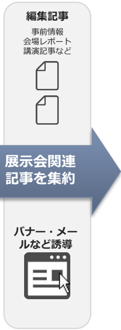
展示会特集ページ (イメージ)