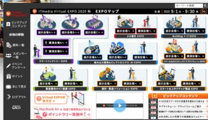
様々な業界のハイブリッド展示会