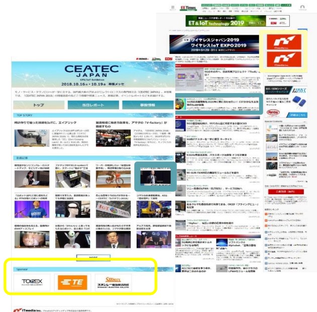
展示会特集ページ