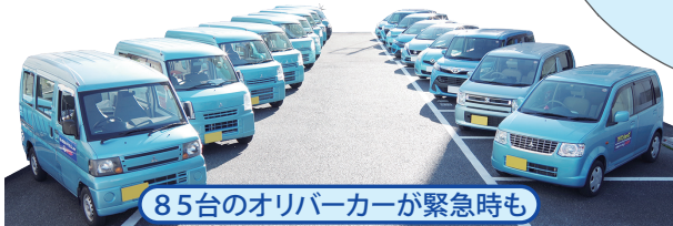
85台のオリバーカーが緊急時