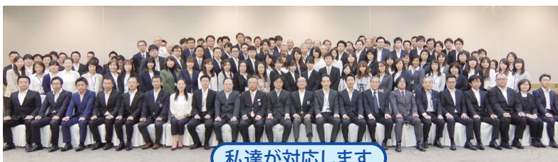
私達に対応します