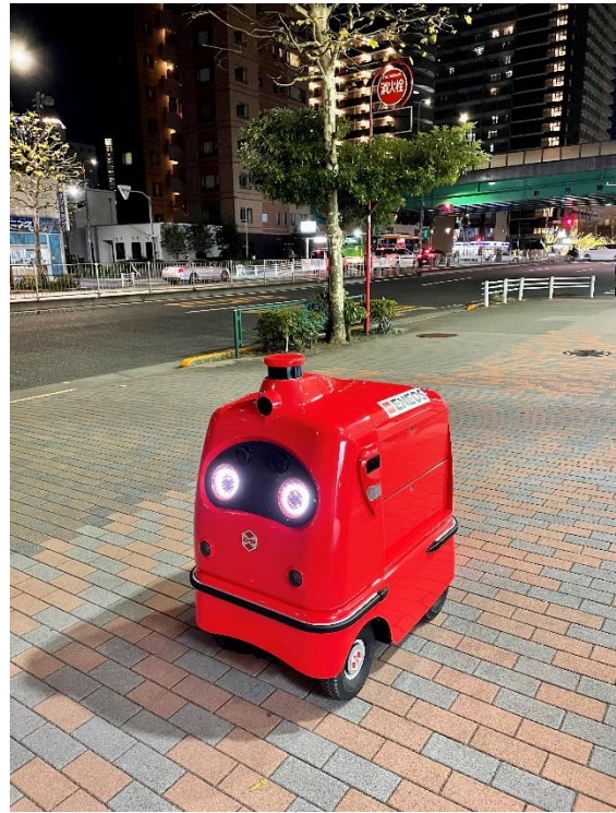
(左) Dr. Drive月島SSに停車している自動宅配ロボット (右) 公道走行中の自動宅配ロボット