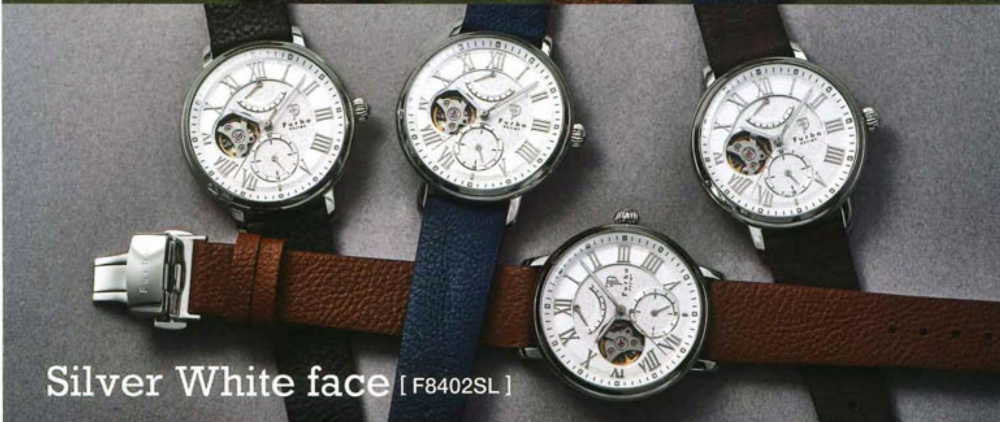
Silver White face [ F8402SL ]