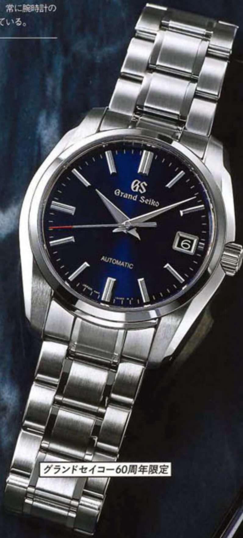
グランドセイコー60周年限定