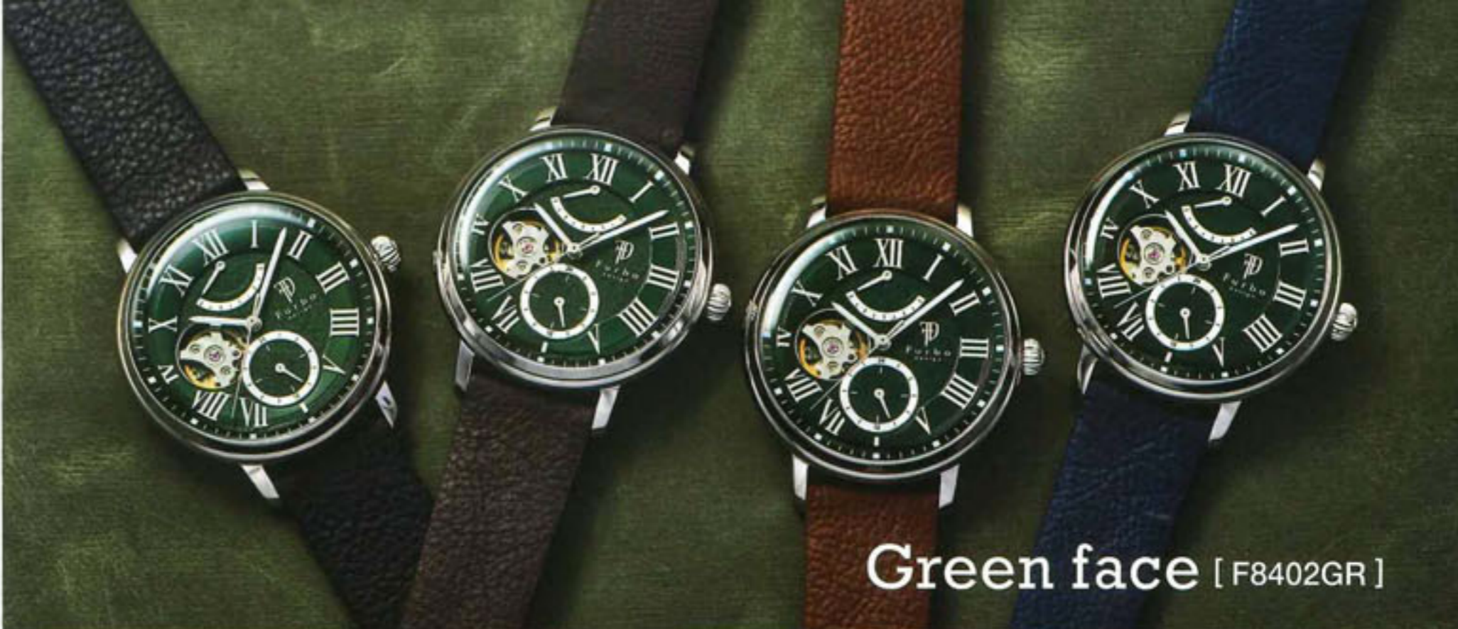
Green face [ F8402GR ]

Text: Hiroyuki Yokoyama Styling: Tatsuhito Yamamine