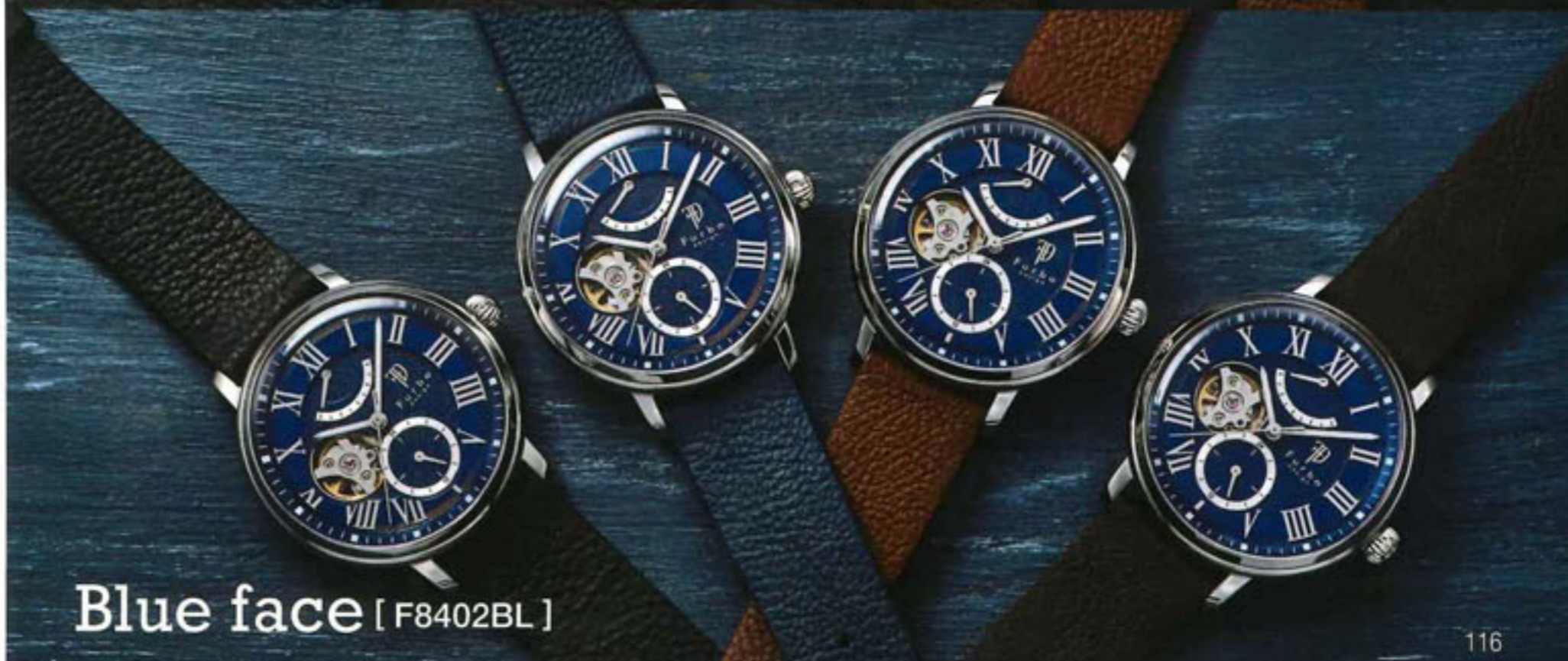
Blue face [ F8402BL ]