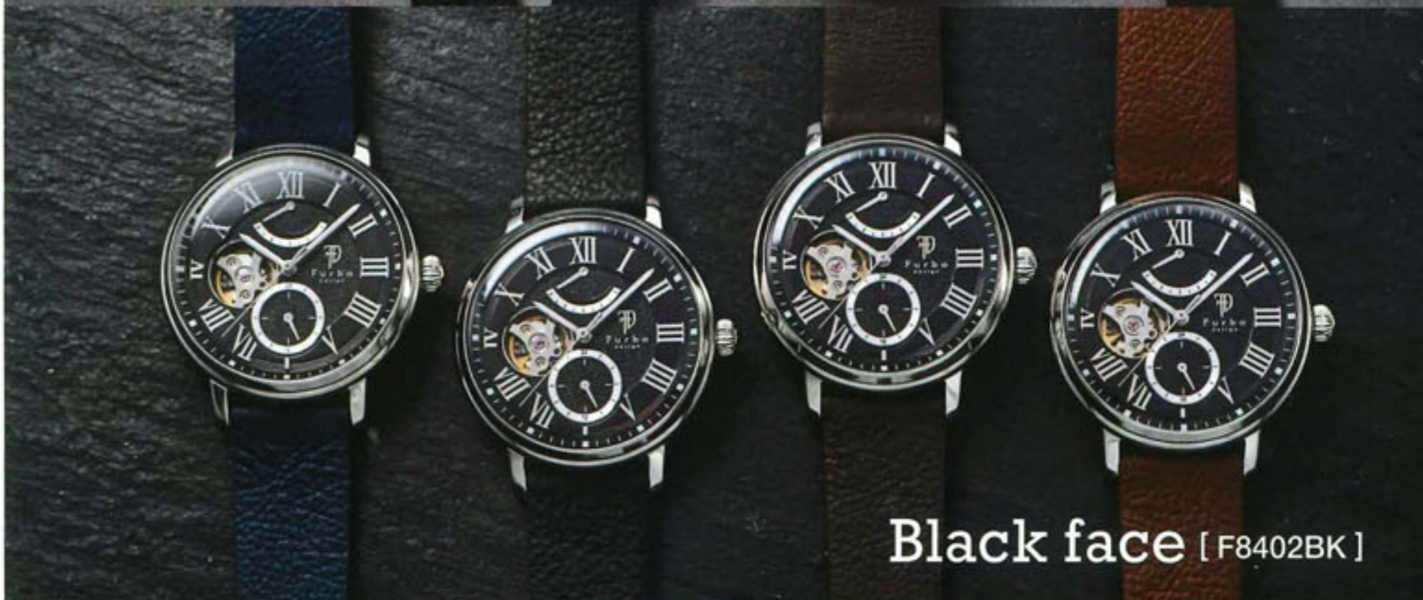
Black face [ F8402BK ]