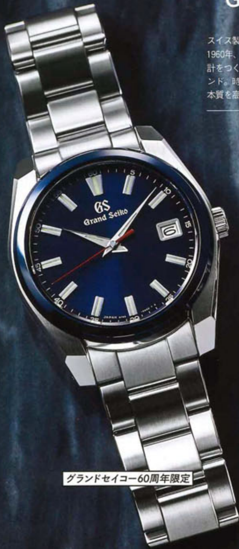
グランドセイコー60周年限定

スイス製が高級腕時計の代名詞とされていた1960年、「世界に挑戦する国産最高級の腕時計をつくる」という志のもとに誕生したブランド。時計技術の粋を結集し、常に腕時計の本質を高い次元で追求し続けている。