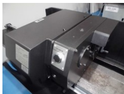
固定軸主軸台 (新作)