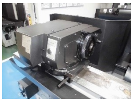
固定軸回転軸兼用主軸台 (新作)