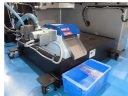
研削油供給装置150L(新作) 磁気分離機(新作) 処理能力：40L/min