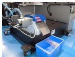
研削油供給装置150L(新作) 磁気分離機(新作) 処理能力：40L/min