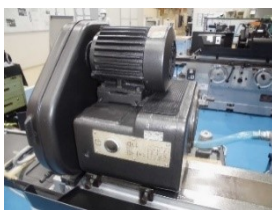
固定軸主軸台 (オーバーホール)