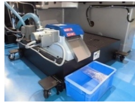
研削油供給装置150L(新作) 磁気分離機(新作) 処理能力：40L/min