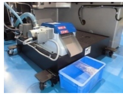
研削油供給装置150L(新作) 磁気分離機(新作) 処理能力：40L/min