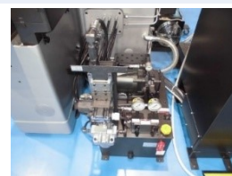
圧油・潤滑兼用 ポンプユニット (新作)