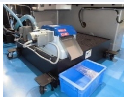
研削油供給装置150L(新作) 磁気分離機(新作) 処理能力：40L/min