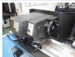
固定軸回転軸兼用主軸台 (新作)