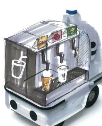
ドリンクサーバー