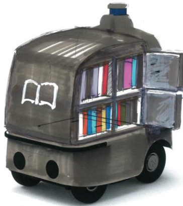
移動図書館（予約者配送）