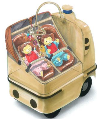
親と一緒に移動 自動ゆりかご

また、歩行速ロボ®三兄弟においては、人と同じように様々なタイプのメガネファッションを楽しんでいただこうと考え、みなさまのご意見を聞きながら、より共感を頂けるような愛されるロボットを目指していきたいと考えております。