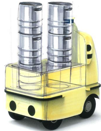
業務用ビール生樽