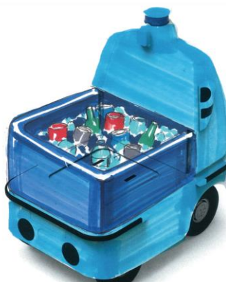
クーラーボックス