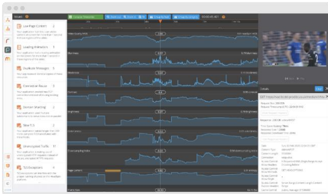
< HeadSpin Compass™パフォーマンスセッション画面 >

2021年1月27日 カリフォルニア州パロアルト – HeadSpin は、開発者がモバイル上でのユーザー体験をテスト・測定・モニタリング・分析できるセルフサービス型のパフォーマンスモニタリングプラットフォーム「HeadSpin Compass™」を販売開始しました。日本を含む世界中に配置されたモバイル端末の実機をリモート操作し、アプリやモバイルウェブの UI/UX をテストすることが可能になります。ソースコードに手を加えることなく、処理時間が遅いページや空白画面の発見など詳細なパフォーマンスデータから KPI を決めて、継続的なモニタリングと改善ができます。