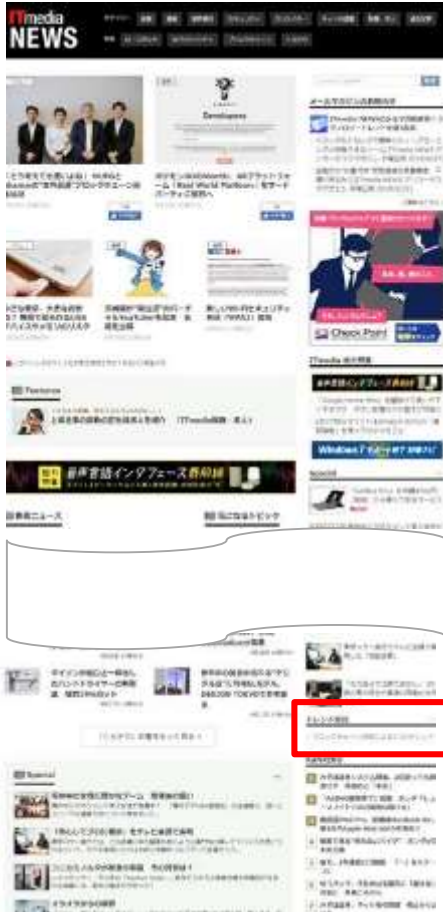
ITmedia NEWS TOP/記事

掲載ページへの誘導は一任いただきます ITmedia NEWSの専用誘導枠を活用 (2W)