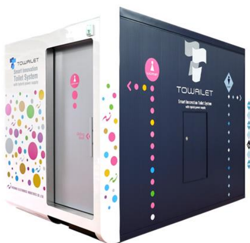
2室タイプのコンセプトモデルを展示予定

本製品は、新しい浄化処置技術と再生可能エネルギー蓄電システムを搭載し平時でも災害時でも衛生的に使えるトイレです。