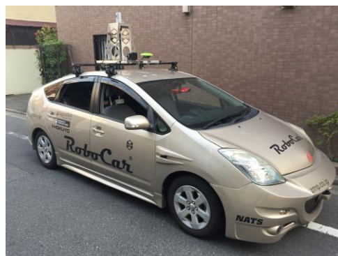
走行データ取得用センサー車両(乗用車)の例