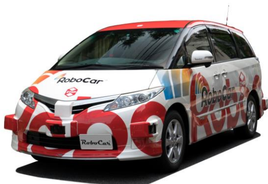
自動運転制御開発プラットフォーム RoboCar MiniVan

会場の関係上、ご参加は、各時間帯で 1 社の事前予約制とさせていただきますが、説明希望の製品など関係なく、皆様の参加をお待ちしております。