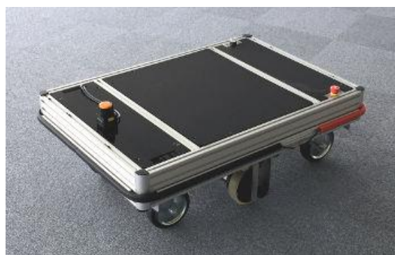
研究開発用移動台車プラットフォーム POWER WHEEL II